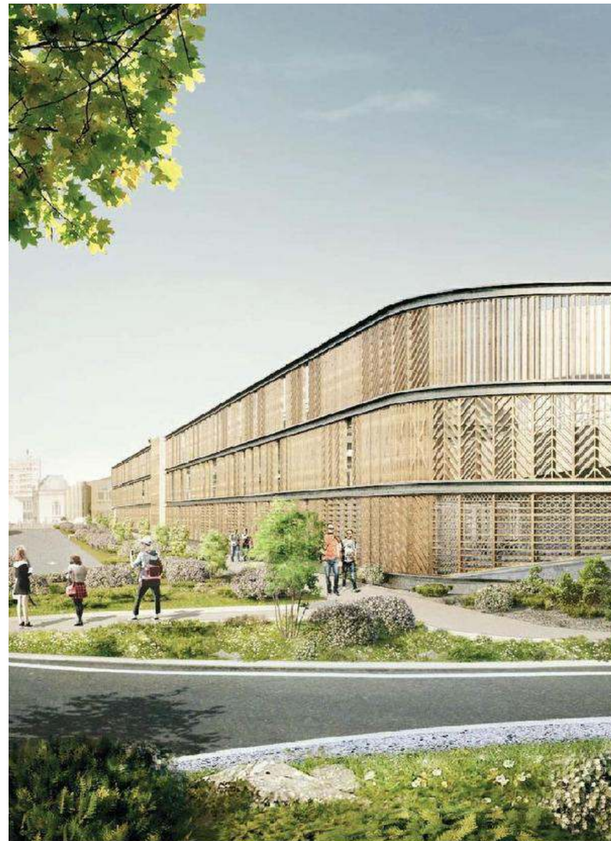
Les automobilistes pourront entrer dans le parking depuis la gare ou depuis le rond-point côté Fort-Chevreuse visible