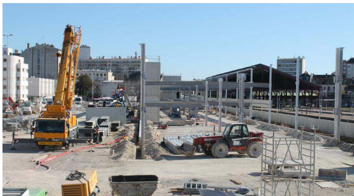
Une trentaine de salariés travaillent en moyenne sur le chantier du parking.