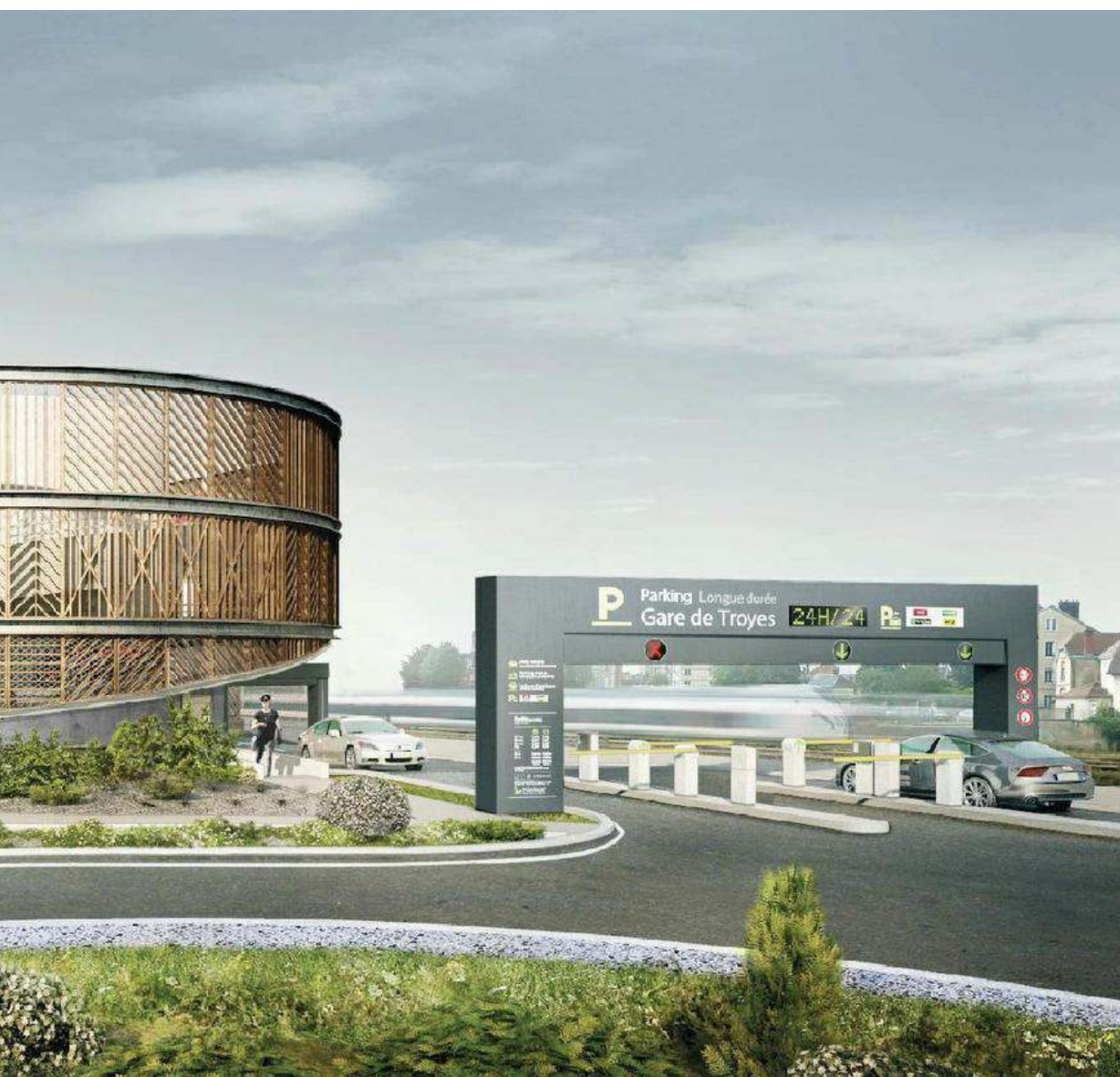
sur cette image. En fin de journée, la sortie s'effectuera également de ce côté pour éviter d'engorger la gare.

en bois pour coller à l'identité de la ville, l'ouvrage géré par Effia marque le renouveau annoncé du quartier.