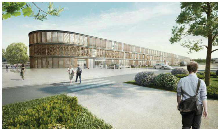
Le parking Effia sera un élément d'ensemble du futur quartier gare dédié au tertiaire. Image Gagnepark.

Situé à Fort-Chevreuse, en face de la salle de sport Vivaform, le terrain vague de 400 m 2 qui sert encore de parking gratuit va être réaménagé : « Nous avons reçu un permis de construire d'une société qui va bâtir des immeubles tertiaires. Trois bâtiments destinés à l'activité tertiaire (11 500 m 2 environ de bureau) vont voir le jour. Ils seront reliés les uns aux autres pour constituer un cœur d'îlot. Le dossier avance bien », précise Valéry Denis, chargé du pôle gare à